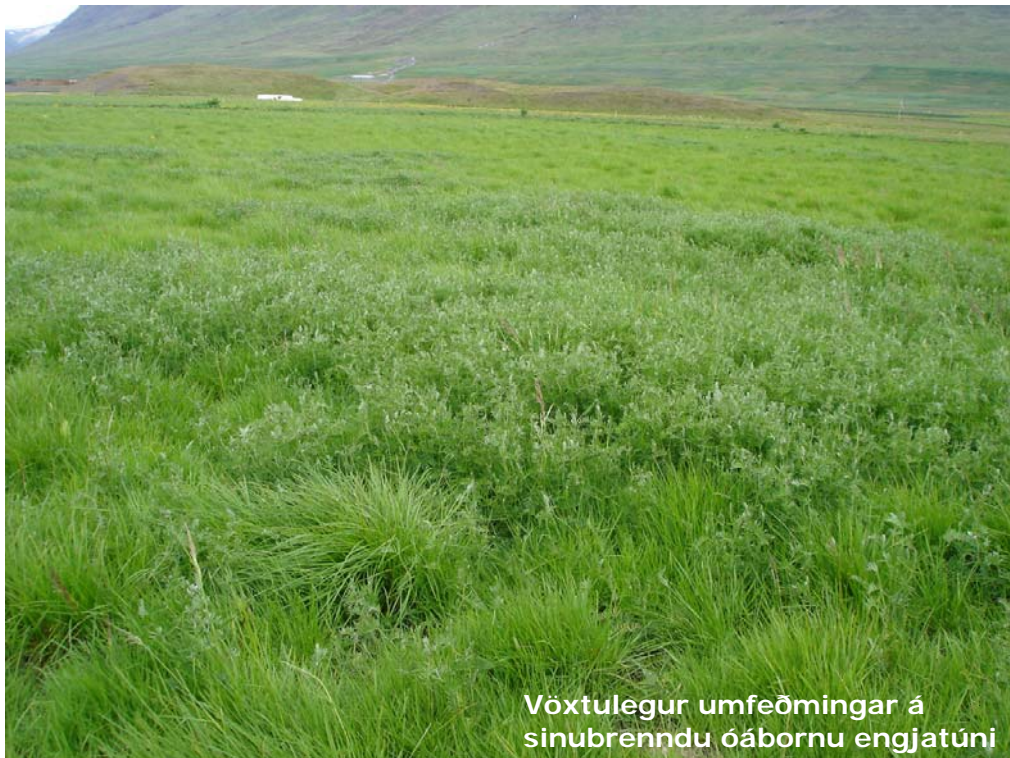
Vóxtulegur umfeðmingar á sinubrenndu óábornu engjatúni