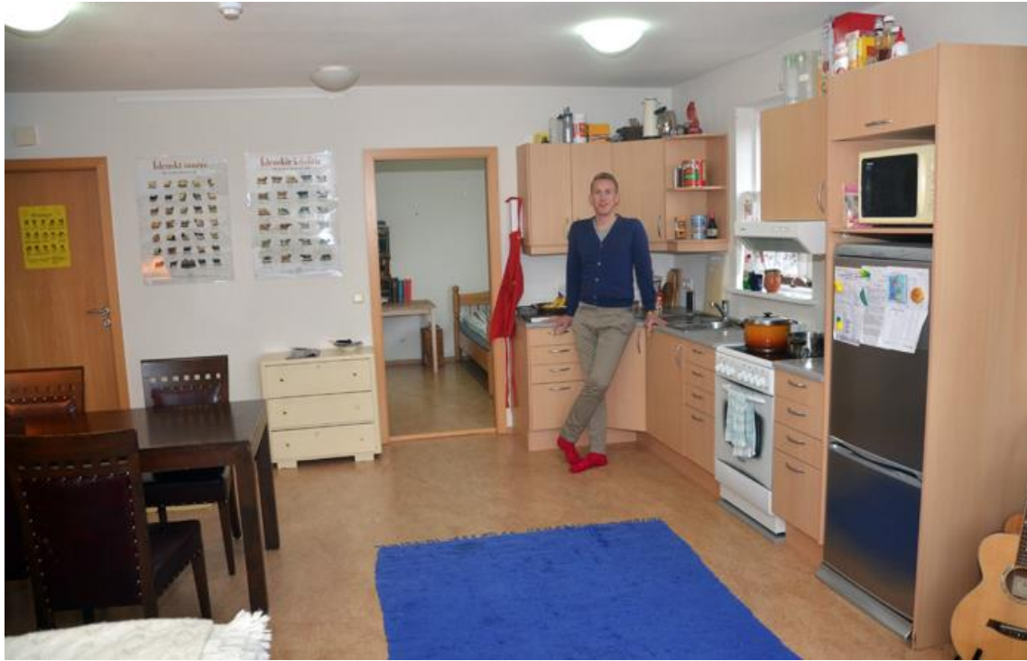
Kíkt í heimsókn í 4ra herbergja íbúð