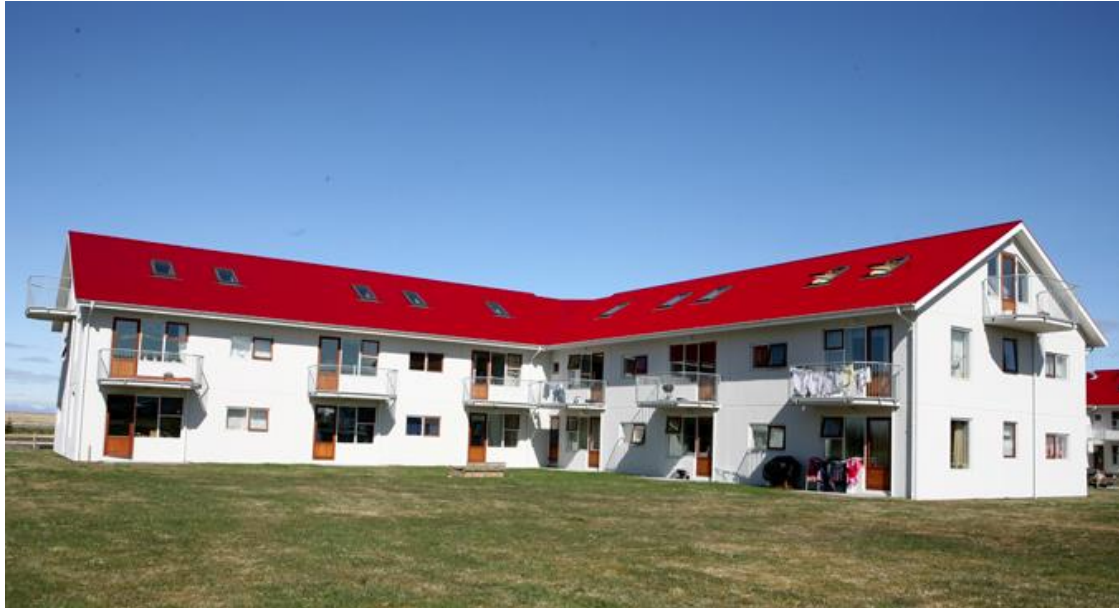
Skólaflöt 7 – blokkirnar fjórar eru allar eins í útliti