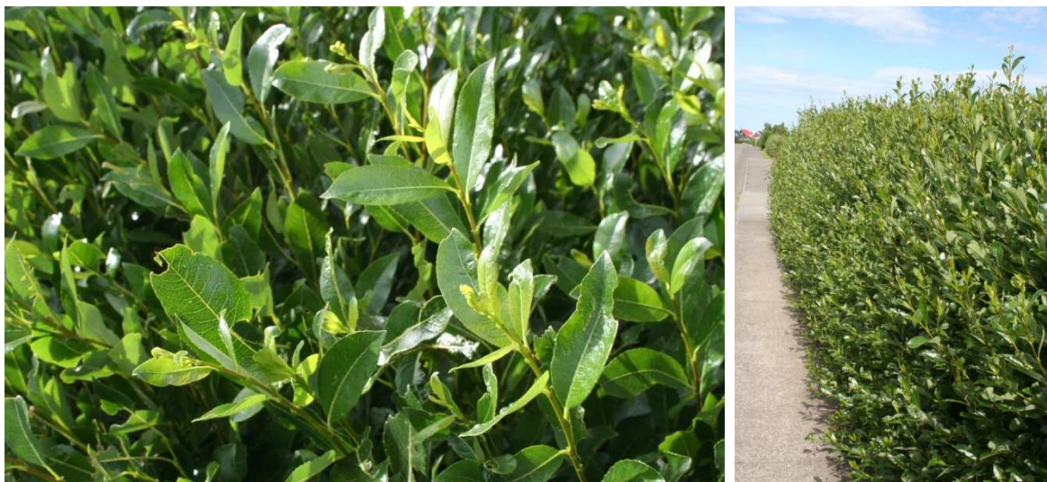
Glitvöðir í limgerði á Blönduósi.