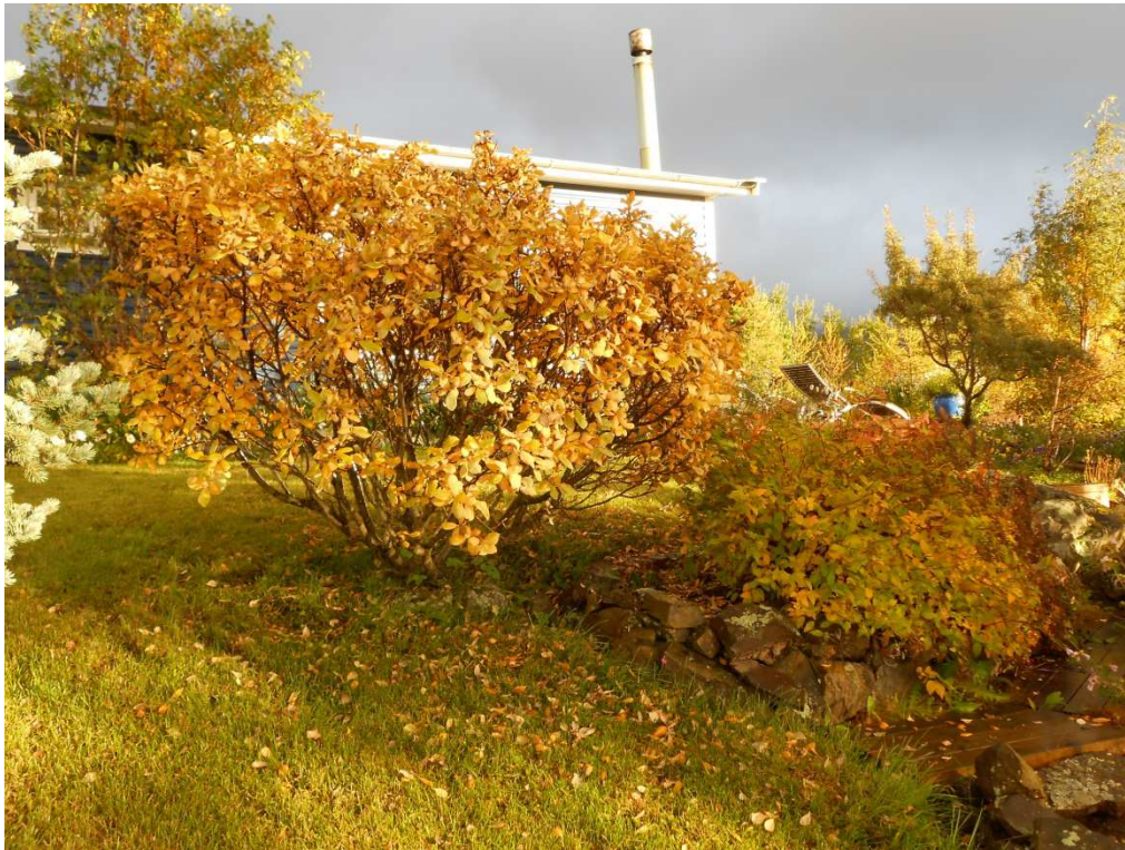
Loðvíðir 'Bolti' í garði Þrastar Eysteinnssonar, tekin í september 2012.

Heimildir: Þröstur Eysteinnsson tölvupóstur 21. nóvember 2011 og símtal 8. febrúar 2013.