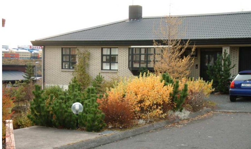
Loðvíðir í haustlitum í garði í Grafarvogi í Reykjavík