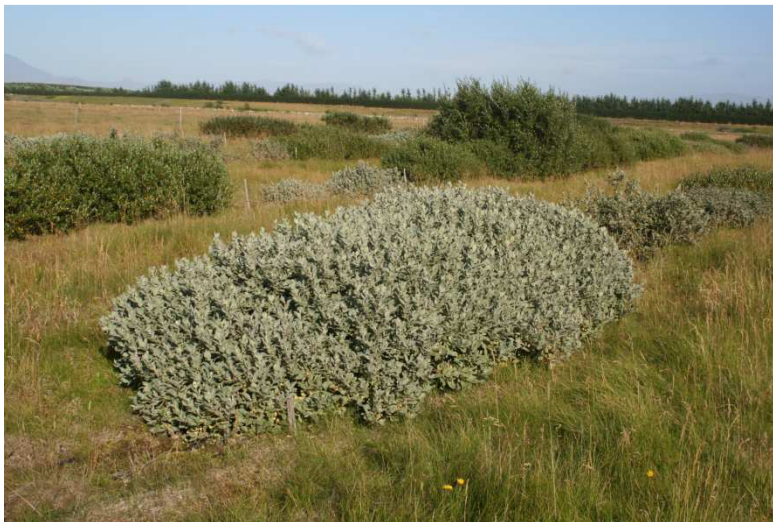
Loðvíðir frá Kaldbaki á Rangárvöllum í víðisafni Gunnarsholti.