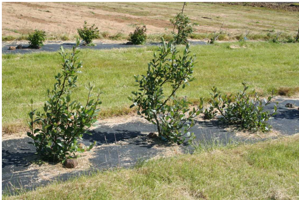
Víðiblendingur 'Rökkur' sumarið 2011 í Sandgerði, gróðursettur 2009.