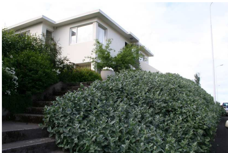
Loðvíðir í garði á Siglufirði