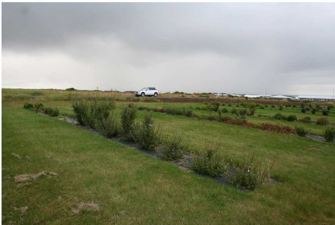
Gulvíðiblandingar í safninu í Sandgerði sumarið 2012, gróðursettur 2009. Næst er yrkið 'Skuld' svo 'Rökkur' þá 'Grásteinn' og að lokum þar sem 'Hreggstaðir' var, en hann drapst eftir annan veturinn eftir að hafa fengið mikinn ryðsvepp ári áður.