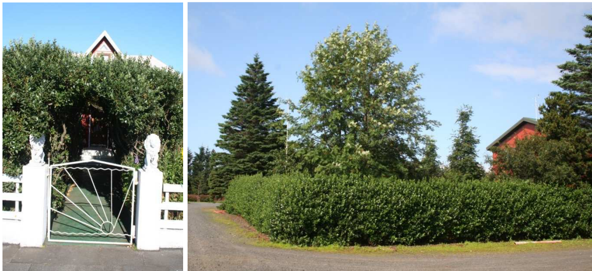
Brekkuvíðir í limgerði í Vestmannaeyjum t.v. og í Reykjavík t.h..