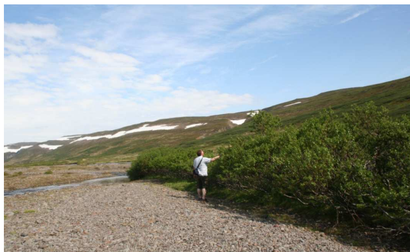
Frá heimkynnum Strandavíðisins í Selárdal í Steingrímsfirði. Mynd: Þórdís Lilja Samsonardóttir, tekin 30. júní 2009.