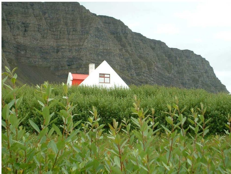
Hreggstaðavíðir í Hringsdal í Arnarfirði.