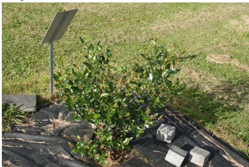
Gulvíðir frá Nauthúsagili í Stóru-Mörk í safni Yndisgróðurs á Reykjum í Ölfusi.

Heimildir: Samson Bjarnar Harðarson. 2012.