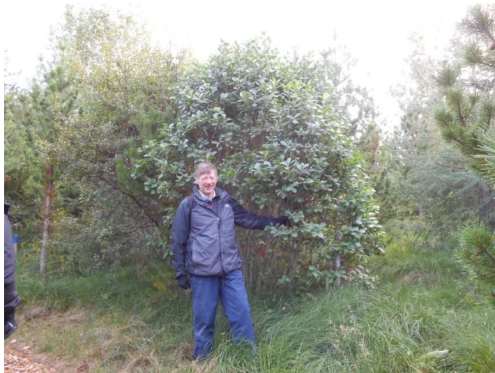
Loðvíðir á Gunnfríðarstöðum í Austur Húnavatnssýslu.