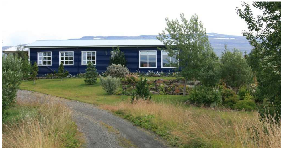
Loðvíðir 'Bolti' í garði Þrastar Eysteinnssonar, runninn er aftarlega fyrir miðri mynd.