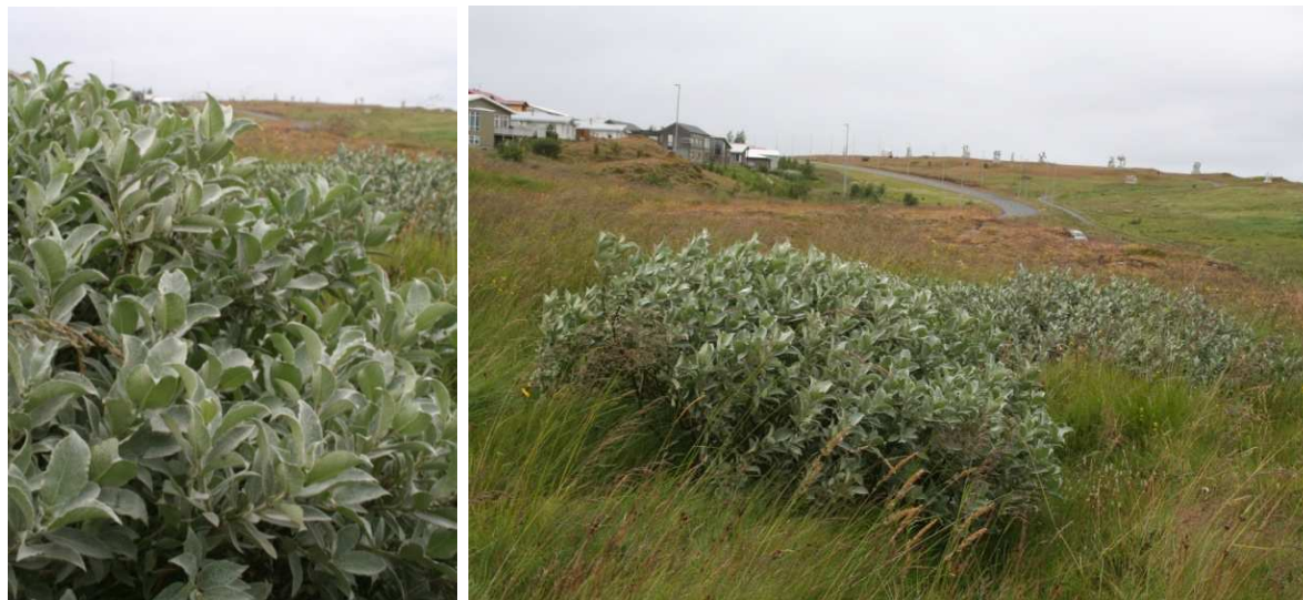
Loðvíðir 'Borgar' upprunalegur runni neðan við íbúðarbyggð í Staðarhverfi í Reykjavík.

Heimildir: Samson Bjarnar Harðarson. 2012. Gagnasafn Yndisgróðurs.