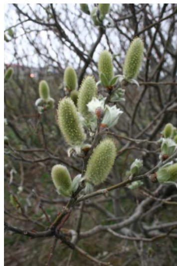
Loðvíðir Orka (Kvk ) rétt við stöðvarhús Orkuveitunnar austan við Rauðavatn í Reykjavík. Mynd tekin í maí 2008.