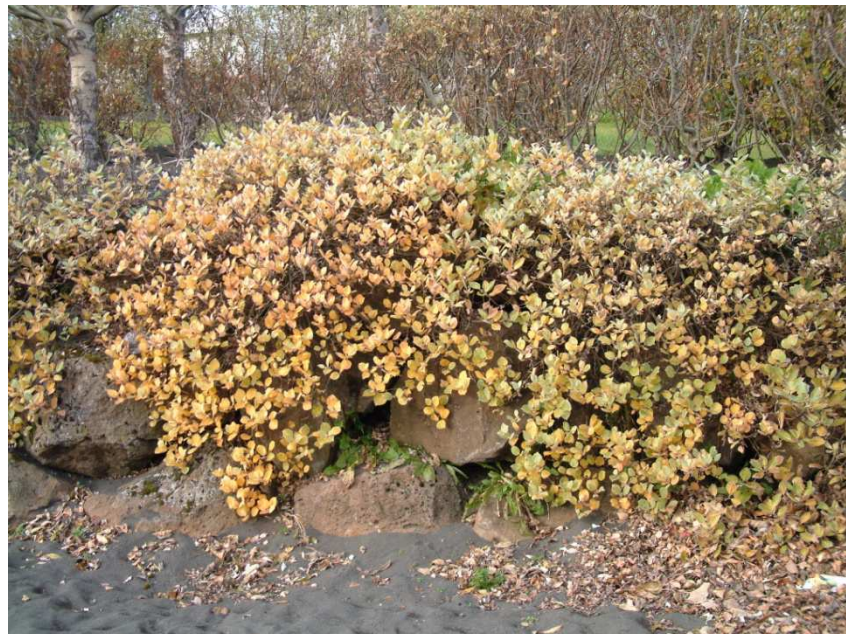
Loðvíðir 'Katlagil' í haustlitum.