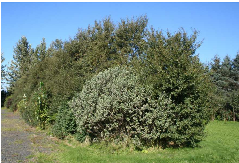
Loðvíðir 'Koti' í Laugardal.