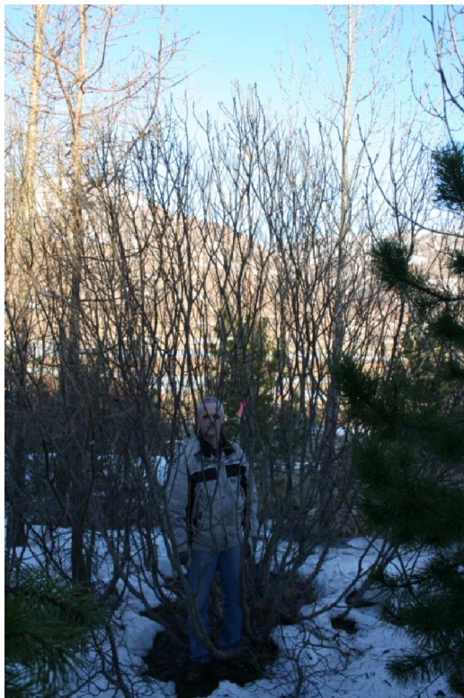
Stórvaxnasti loðvíðirinn sem fannst á Gunnfríðarstöðum í Austur Húnavatnssýslu. Runninn er vel yfir 4 m á hæð og sverleiki aðalgreina um 6 cm í þvermál og um 30-40 ára gamall. Mynd tekin 23 febrúar 2013.