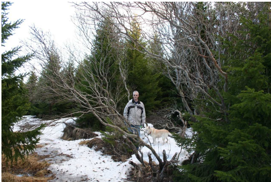
Einn elsti loðvíðirinn sem fannst á Gunnfríðarstöðum í Austur Húnavatnssýslu. Runninn er um 4 m á hæð og sverleiki aðalgreina um 10 cm í þvermál og 41 árs gamall. Mynd tekin 23 febrúar 2013.