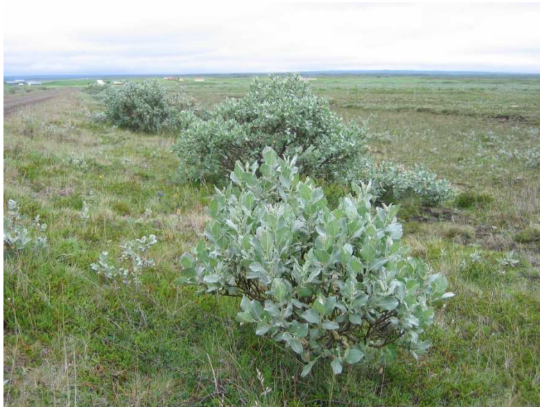
Loðvíðir í sendum móa í Kelduhverfi.