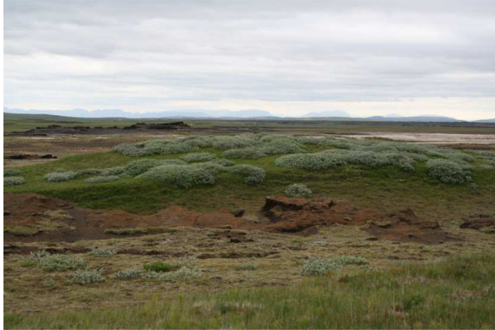
Loðvíðir í uppgróinni sandöldu við Bolöldu á Rangárvöllum.