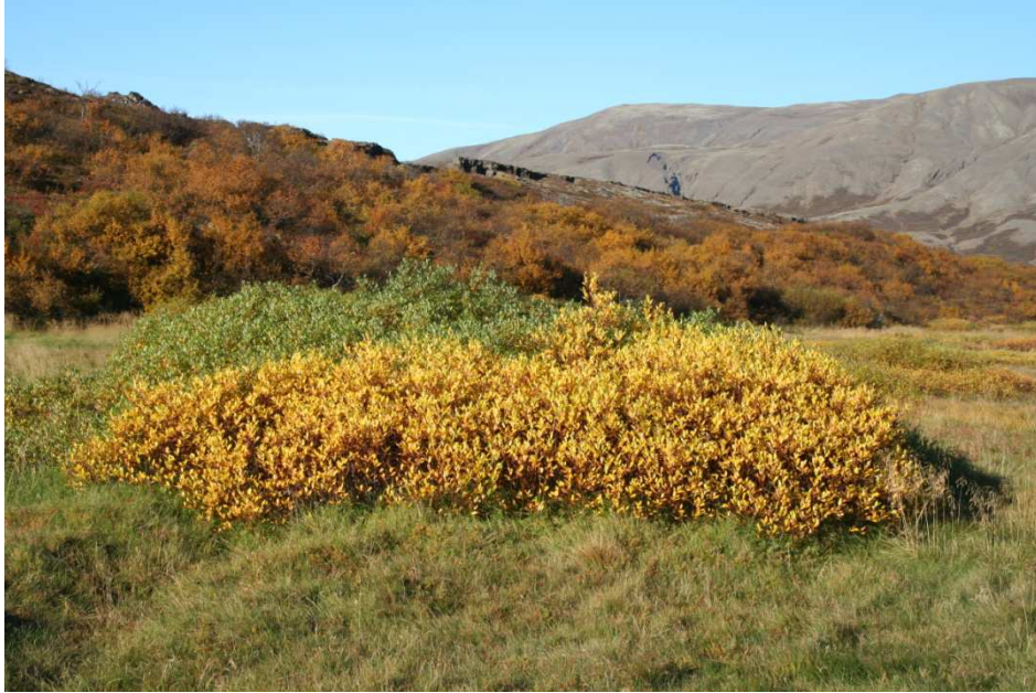
Gulvíðir á Þingvöllum