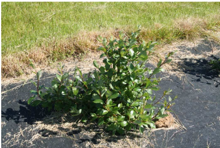
Víðiblendingur 'Skuld' sumarið 2011 í Sandgerði, gróðursettur 2009.