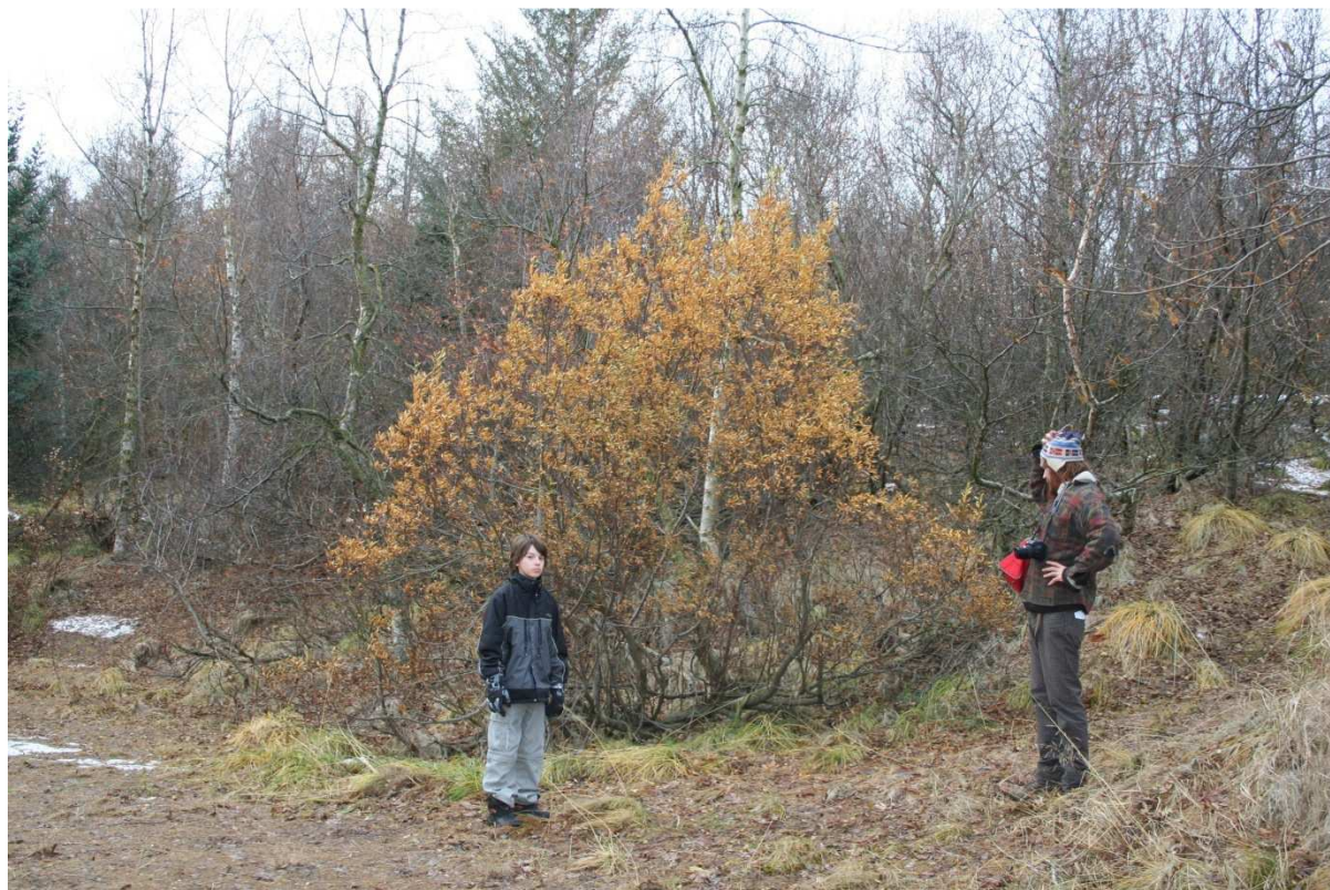
Eldgamall gulvíðirunni ofan við Kristneshælið, gæti verið ættaður frá Sörlastöðum sem Flensborg kom í ræktun um aldarmótin 1900.

Flensborg, C.E. 2007 (1905). Islands Skovsag. í Islands Skovsag- Skógræktarmálefni Íslands - skýrslur og ritgerðir 1901-1916. Landbúnaðarráðuneytið:7-23.