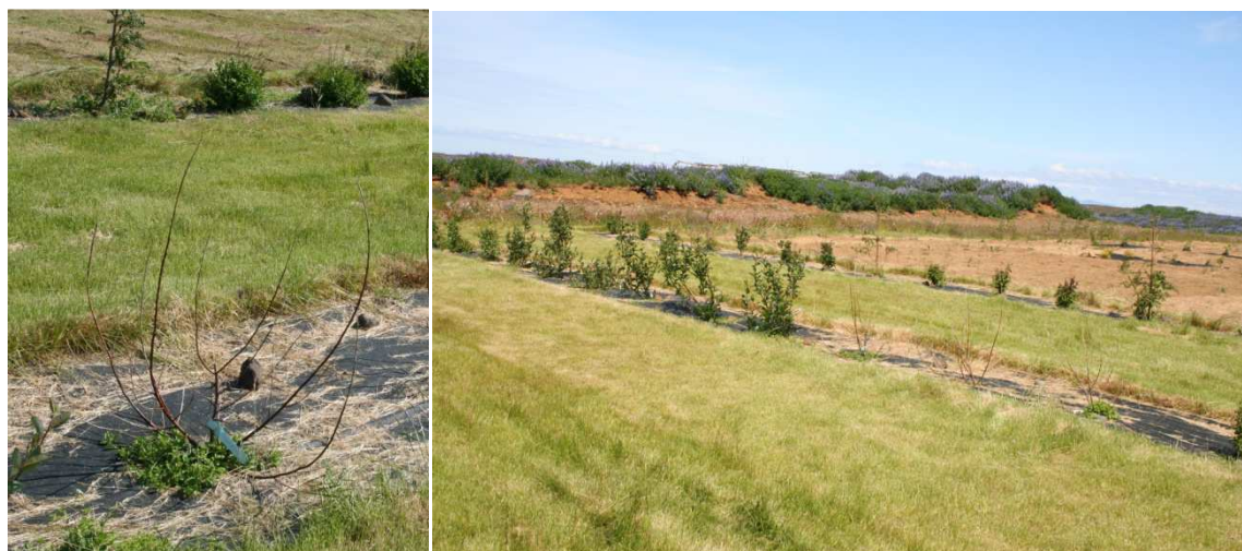
Víðiblendingur 'Hreggstaðir' t.v., og víðiblendingar í safninu í Sandgerði árið 2011, t.h, yrkið 'Hreggstaðir', er næst en hann drapst eftir annan veturinn eftir að hafa fengið mikinn ryðsvepp ári áður.