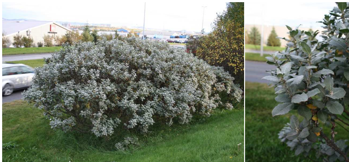
Loðvíðir Skeiðarvogur í Reykjavík. Mynd tekin í september 2006.