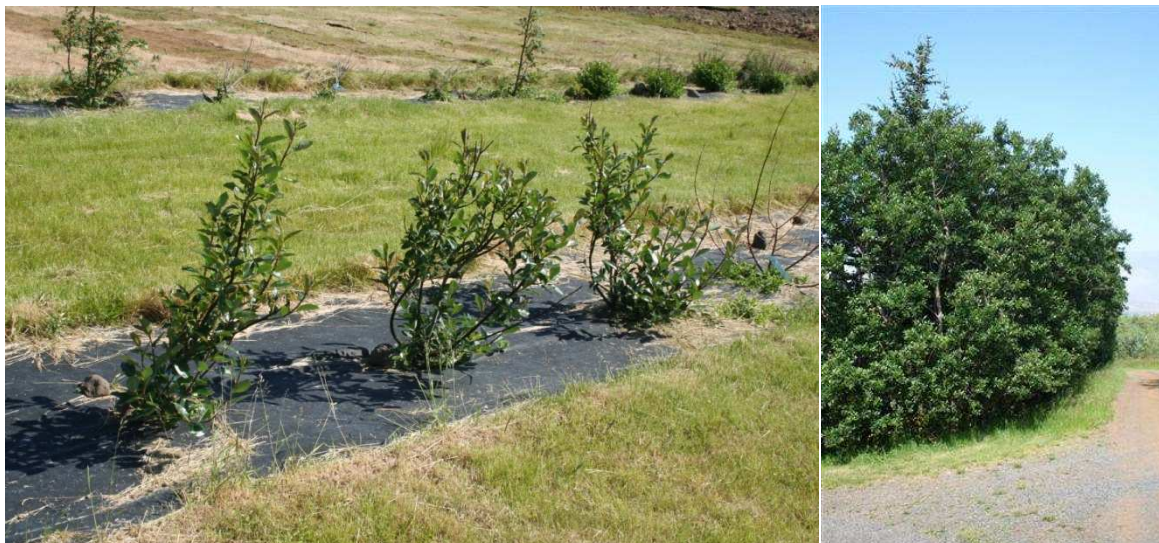
Hreggstaðavíðir í Sandgerði sumarið 2011 t.v. og í limgerði í garðplöntustöðinni Gróanda á Grásteinum t.h..