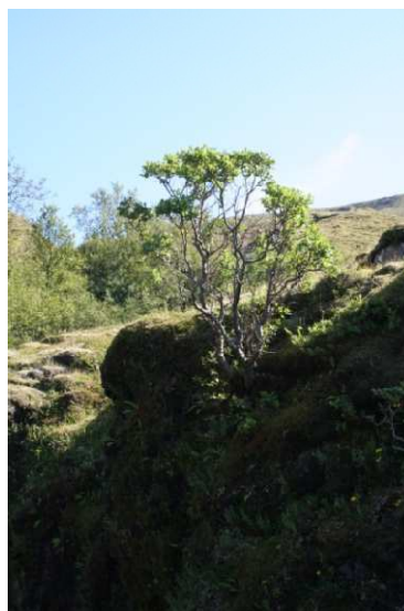
Gulvíðir sem líkist Brekkuvíði neðarlega í Nauthúsagili í Stóru-Mörk. Myndin er tekin 9. júlí 2008.