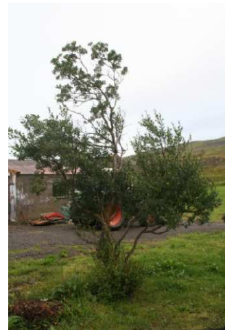
Strandavíðir í Tröllatungu í Steingrímsfirði, upphafleg móðurplanta var klippt niður vorið 2009, á öðrum stað á bænum var yngri planta sem er um 3 m. á hæð.