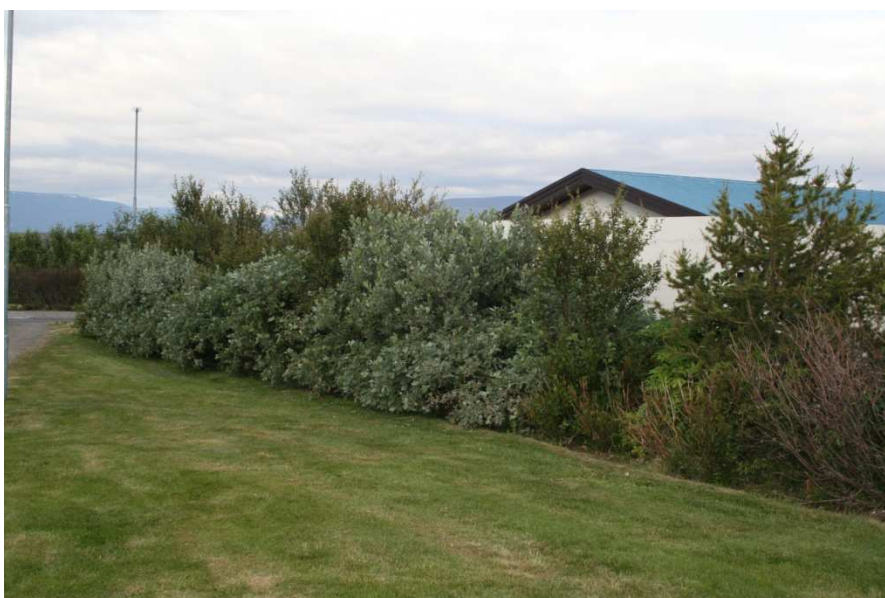
Loðvíðir í garði á Sauðárkróki