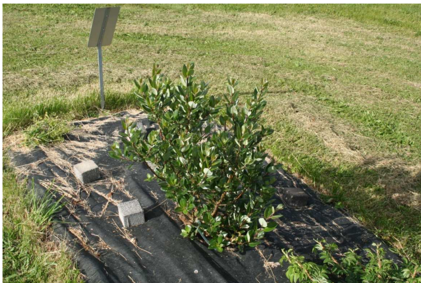
Gulvíðir frá Holtsdal í safni Yndisgróðurs á Reykjum í Ölfusi.