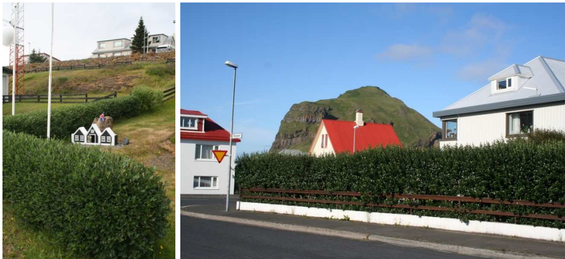
Strandavíðir í limgerði á Hólmavík t.v. og í Vestmannaeyjum t.h..