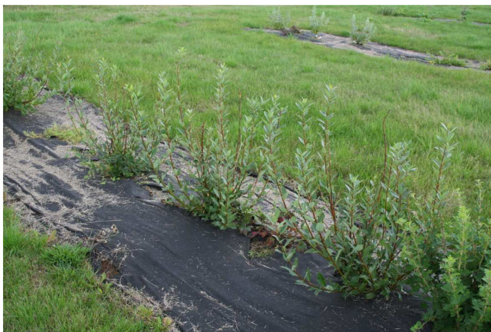
Víðiblendingur 'Þorlákur' sumarið 2012 í Sandgerði, gróðursettur 2010

Heimildir: Ólafur S. Njálsson, tölvupóstur 17. janúar 2013.